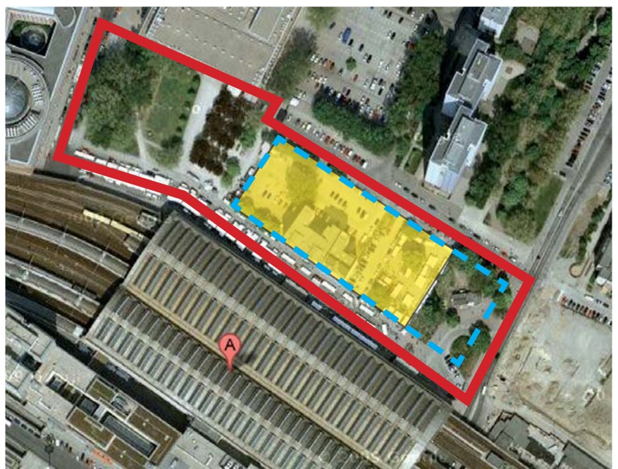
Abbildung: Studie der Fraktion: verkleinertes Bau- feld gemäß Antrag (Gelb), geplanter Bau- körper (Blau), Platzbereich am rechten Rand des Geltungs- bereiches

Anlage: Eigentumsverhältnisse im B-Planbereich V-44